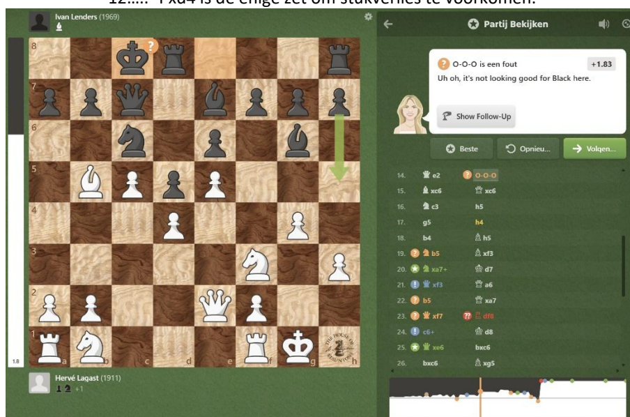
Volgens Chess.com is de lange rokade hier fout, wit staat vanaf hier ineens heel wat beter gequoteerd!