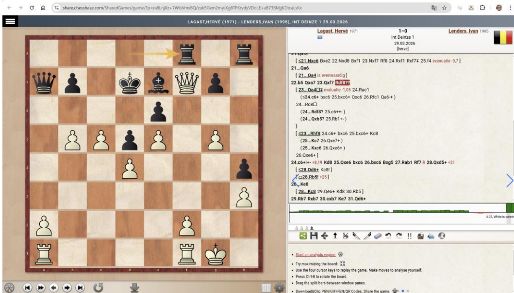
Best dat Hervé Lagast wat extra uitleg geeft omtrent deze ChessBase methodiek?

De analyse-resultaten via Chess.com en ChessBase zijn uiteraard gelijkaardig ... maar met toch enkele nuances. Zie deze analyse door Hervé Lagast via ChessBase (inclusief varianten en commentaar):