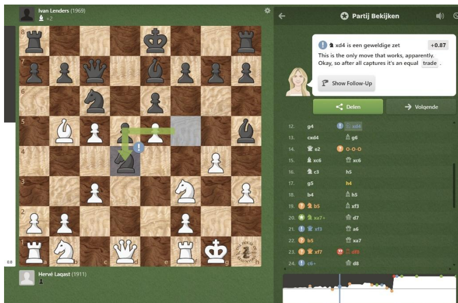
12....- Pxd4 is de enige zet om stukverlies te voorkomen.